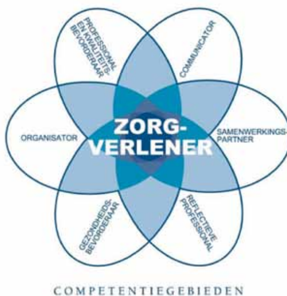
Figuur 1. CanMEDS-systematiek

In de inleiding van dit document is te lezen dat het Expertisegebied verpleegkundige OGZ beschouwd dient te worden als een aanvulling op het beroepsprofiel van de verpleegkundige (Lambregts & Grotendorst, 2012). Het beroepsprofiel beschrijft de elementen van het beroep die voor elke opgeleide verpleegkundige van toepassing zijn en dus ook voor de verpleegkundigen die onder een expertisegebied vallen. Om de verbinding tussen het beroepsprofiel en het expertisegebied duidelijk te maken komen de kennis en vaardigheden uit het beroepsprofiel terug in het Expertisegebied. Vervolgens worden vanuit deze basis de aanvullende kennis en vaardigheden, ook wel expertise, van de verpleegkundige OGZ beschreven. Dit alles wordt uitgewerkt aan de hand van de CanMEDS-systematiek (Canadian Medical Education Directions for Specialists). Deze systematiek bestaat uit zeven verschillende rollen. De kern van de beroepsuitoefening is de verpleegkundige als zorgverlener. Alle andere rollen raken aan die centrale rol. De rol van zorgverlener geeft richting aan de andere CanMEDS-rollen.